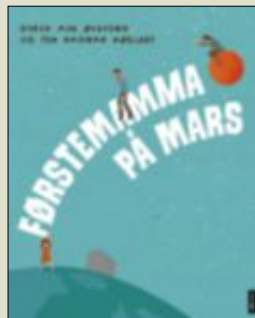
Gryd Axe Øvsteng Per Ragnar Møkleby «Førstemamma på Mars» Samlaget